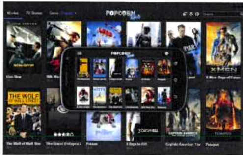
Popcorn Time gjør det lett å se filmer og serier med torrent.

Popcorn Time har gjort denne tre-trinns prosessen enklere og mere flytende. Med dette programmet er det lettere enn noen sinne å laste ned og se programmer med torrent